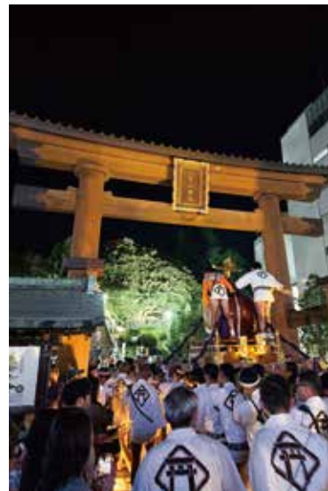
一番の見どころは、「バンパの太鼓神輿」の石段上がり!勇ましく、地響きのように太鼓を鳴らしながら登る姿は、まさにイナセな夏の風物詩です。

今週から行われる二荒山神社の末社、須賀神社の夏祭り「天王祭」。この祭は、須賀神社のご祭神、須佐之男命(スサノオノミコト)によって邪気(夏の疫病)をはらう祭りで、平安時代の869年京都に疫病が流行した時に、それを鎮めるために行われたのが始まりと言われます。有名な京都の八坂神社の祇園祭に始まり、全国各地で祇園祭、天王祭、須賀祭などと呼ばれ行われている普遍的な夏祭です。