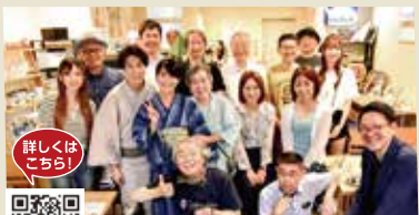
講演講師(手前)と、ヒーローにする会